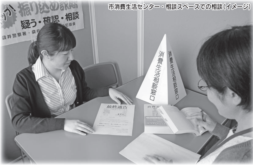
市消費生活センター・相談スペースでの相談(イメージ)