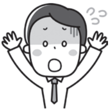
平成27年度に、市消費生活センターに寄せられた相談

相談内容は、「不審なメールが来て、お金を振り込んでしまった」・「通信販売で購入した商品が届かない」・「スーパーマーケットで買った肉の分量が、表示量より少なかった」など、店舗販売や訪問販売など直接顔を合わせて行われる取引に関するものだけでなく、インターネットの普及に伴い、直接顔を合わせることなく行われる取引に関するものも寄せられています。