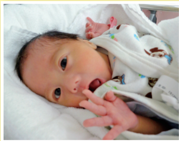
① ちいさな歌舞伎役者☆