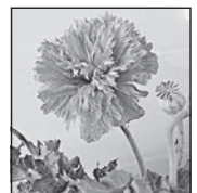
ソムニフェルム種