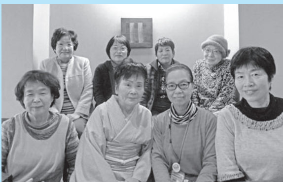
「ほい布井劇団」の皆さん

講座受講を希望される団体や劇団メンバーになってみたい方を随時募集しています。興味をお持ちの方は、市消費生活センターまでお問い合わせください。