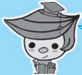
大学マスコット キャラクター 「お理工ちゃん」

今回は、大学教員のほか、磐田・掛川市内の高校生たちによる研究発表を行います。わかりやすく研究内