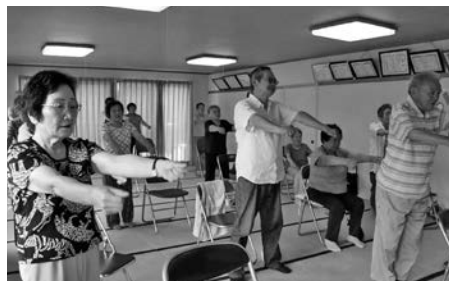
この画像は、「Pictu AR」で動きます。でん伝体操の様子を動画でご覧ください。「Pictu AR」について詳しくは11ページをご覧ください。

◆「近くの開催会場を知りたい」、「身近な場所で仲間と新しく始めたい」、「家族に紹介したい」場合など、お気軽にご相談ください。