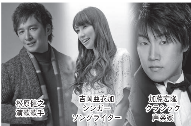
松原健之 演歌歌手

時平成29年1月15日(日) 昼の部 開場…午後1時30分 開演…午後2時 夜の部 開場…午後6時 開演…午後6時 30分 所月見の里学遊館・うさぎホール 内ふるさと応援 プロジェクト、かつて同じ袋井高校で学び、それぞれのジャン ルで活躍している松原健之さん、吉岡亜衣加さん、加藤宏 隆さんの3人を迎え、月見の里ならではのコンサートを開催 対どなたでも ※未就学児入場不可 定各部…363人(別途 車椅子席6席) 料前売り券…一般3,500円、高校生以下 1,500円(全席指定) チケット販売開始…10月15日(土)午 前9時～ ※市役所売店のみ10月17日(月)から チケット 販売場所…月見の里学遊館、市役所1階・売店、兵藤楽器本 店・磐田店ほか 電話予約…10月15日(土)午後1時～(月見 の里学遊館のみ)