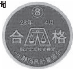
定期検査済合格ステッカー

◎はかりの定期検査を受けましょう 取り引きや証明に使用するはかりは、県が実施する2年に1回の定期検査を受ける必要があります。対象は食料品店、宅配便取扱店、薬局などです。