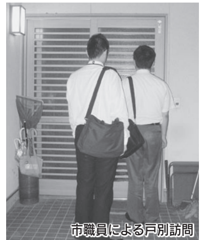
市職員による戸別訪問