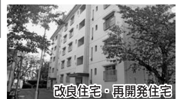
改良住宅・再開発住宅