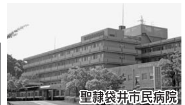
聖隷袋井市民病院

◆改良住宅・再開発住宅は、市内に複数ある団地の総称です。改良住宅3団地25戸、再開発住宅2団地38戸。