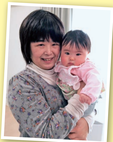
2 可愛い初孫にデレデレ