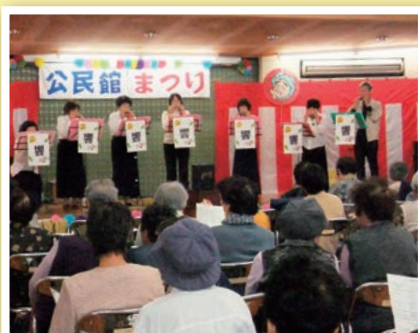
4 きれいな音色を届けます！