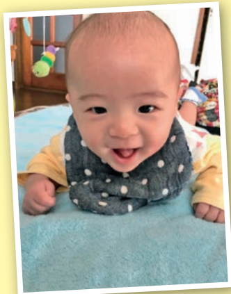
① 寝返りできるようになったよ！

「街の写真館」では、地域やサークルの行事、お気に入りの写真やお子さんの写真などをお待ちしています！住所・氏名・電話番号・写真のタイトルと簡単なコメントを書き添えて、郵送・Eメールでお送りください。 送り先 〒437-8666 袋井市役所企画政策課シティブロモーション室 「街の写真館」 ✉ kikaku@city.fukuroi.shizuoka.jp