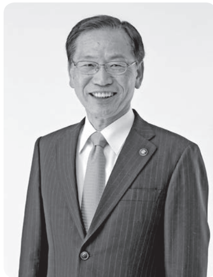
袋井市長 原田英之

残すところあとわずか「平成」が終わりを告げます。この30年間を振り返ると度重なる全国各地での大規模災害やグローバル社会の進展などにより私たちのライフスタイルや価値観が多様化するなど、大きな変革の時代であったと感じています。