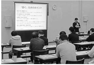
ゲートキーパー養成講座の様子

「行政」は、市民に身近な存在として、相談窓口の充実や周知、悩んでいる人に気付き、声を掛け、話を聴き、必要な支援につなげ、見守るゲートキーパーの育成、関係機関との連携強化などを通して、包括的に自殺対策に係る環境づくりに取り組みます。