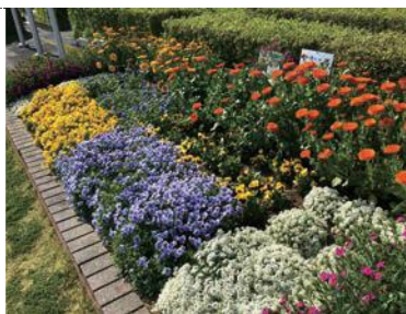
三川コミュニティセンター