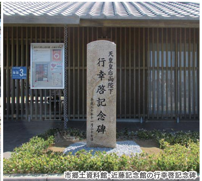
市郷土資料館・近藤記念館の行幸啓記念碑