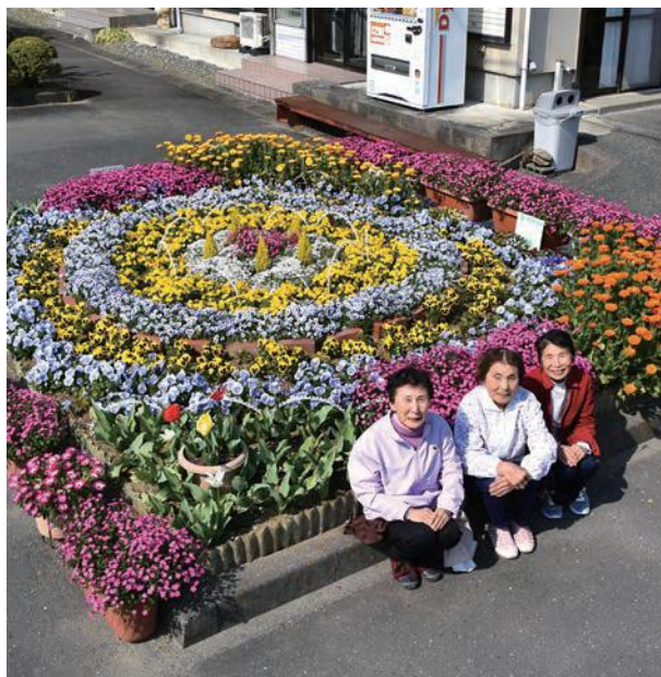
山田花の会(花壇と管理されている皆さん)