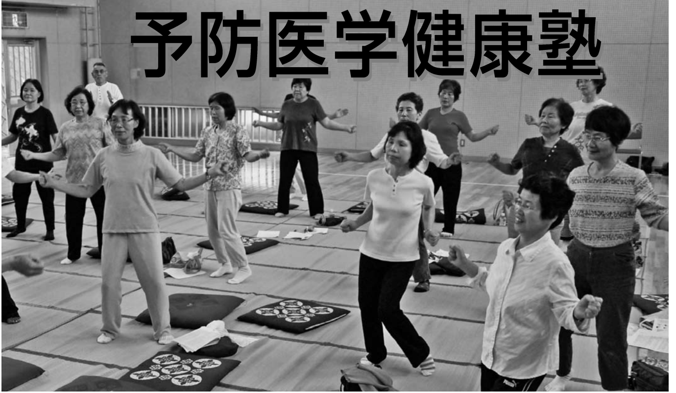
浅羽北公民館で行われた予防医学健康塾

自分の健康を自分で守るための基本的な考え方や実践方法を学ぶ予防医学健康塾。今年で3年目を迎え、実践されている方からは、非常に効果があるという声をいただいています。