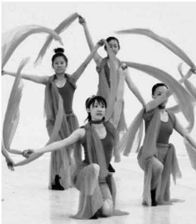
第22回国民文化祭・とくしま2007公式記録より

袋井市主催事業 「スポーツ文化フェスティバル in FUKUROO」 日 平成21年10月31日(土)・11月1日(日) 所 エコパアリーナなど