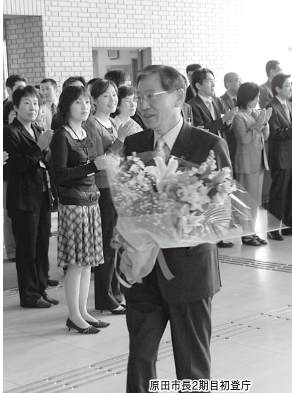
原田市長2期目初登庁 原田英之の袋井市長2期目がスタート(4月24日)