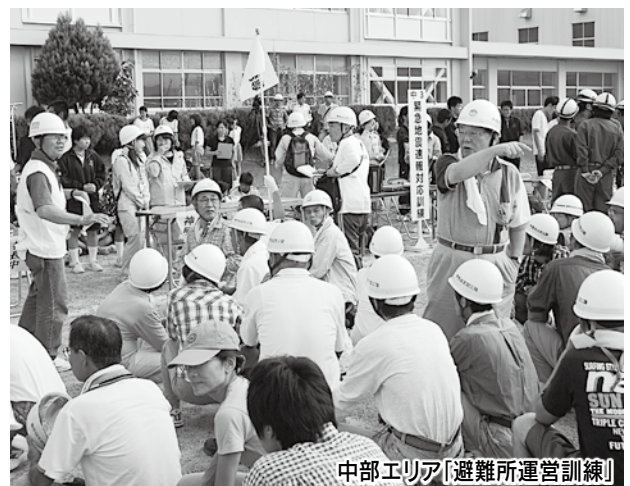
中部エリア「避難所運営訓練」