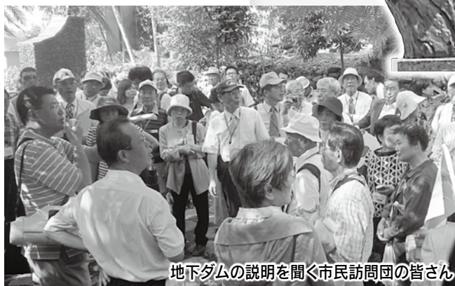
地下ダムの説明を聞く市民訪問団の皆さん