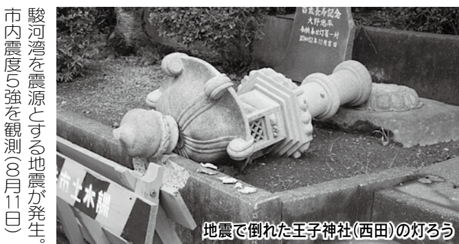
駿河湾を震源とする地震が発生。 市内震度5強を観測(8月11日)

国民文化祭を静岡県で開催。袋井市では「スポーツ文化フェスティバルinFUKUROI」を実施(10月31日、11月1日)