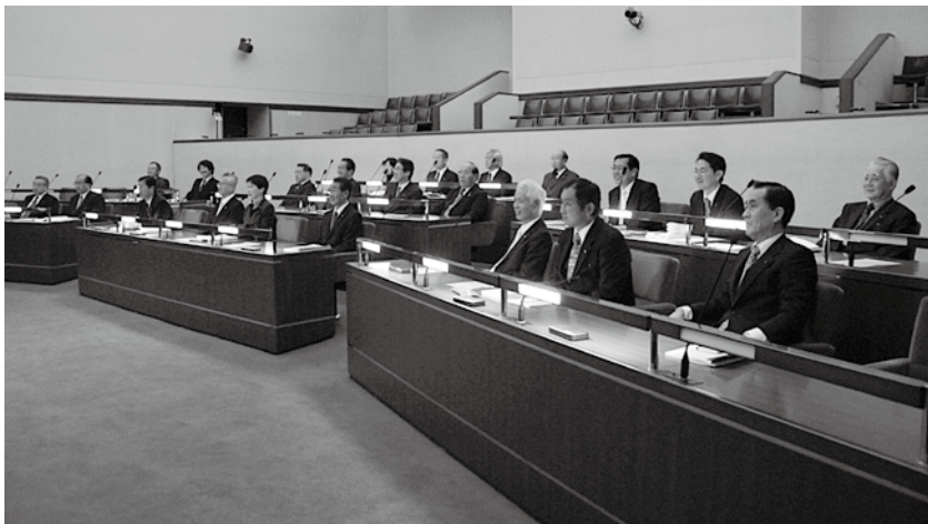
袋井市議会議員選挙(4月19日) 定員26人から22人に