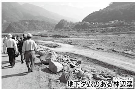
地下ダムのある林辺溪