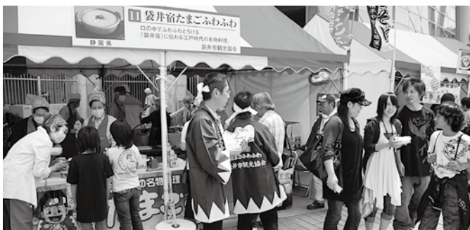
全国B級グルメスタジアム(5月23日・24日) 袋井市からは「たまごふわふわ」が出演