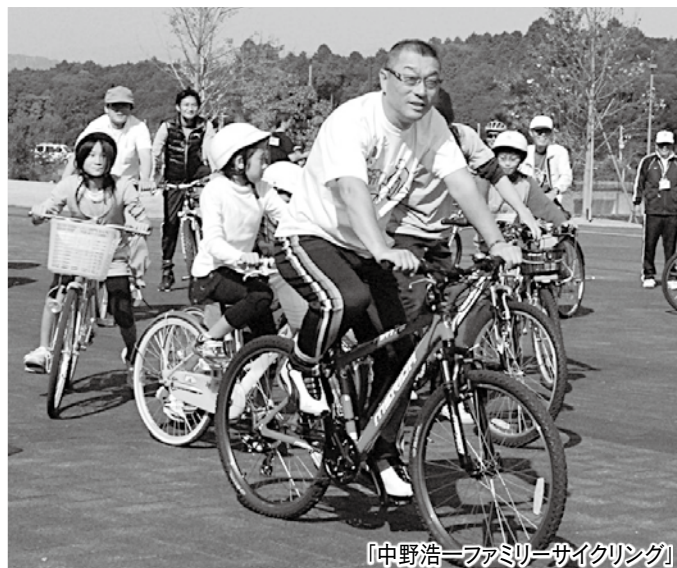
『中野浩一ファミリーサイクリング』

平成21年(2009)年を振り返り、 袋井市の大きなニュースをまとめました。 秘書広報課広報広聴係 ☎44-3104