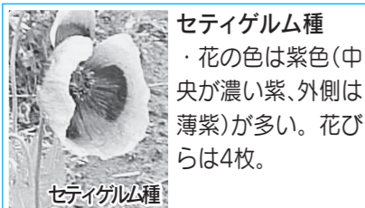
セティゲルム種 ・花の色は紫色(中央が濃い紫、外側は薄紫)が多い。花びらは4枚。

◇違法なケシは、栽培や採取が法律で厳しく規制されています。また、ケシを許可なく栽培した場合、処罰を受ける場合があります(観賞用としての栽培であっても、処罰の対象です)。