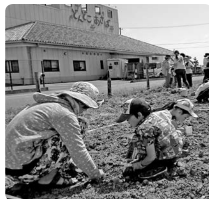
今年6月、地域のボランティア約50人が種まきに参加