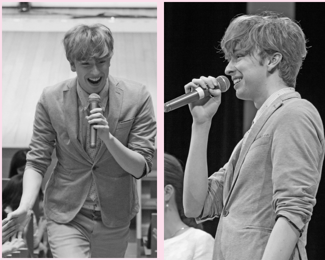
「ふるさと296」感謝祭では私たちに歌と笑顔を届けてくれました

僕も微力ながら、ふくろい未来大使として、またふくろい「まるごとインターナショナル」広報部長として、一生懸命、皆さんと一緒に袋井市を盛り上げ、応援させていただきます。どうぞ、よろしく願います。