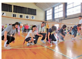
袋井東7学級による合同運動会(袋井東小学校体育館)