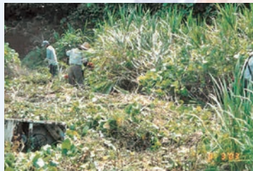
荒れた山の草刈りをする皆さん

「子どもたちのためにあの頃の里山を取り戻したい」との思いが募り、16年前、ついに再生への取り組みが始まりました。草刈りや間伐、沼地の埋め立てなど、ひたむきな作業を積み重ね、約6年の歳月を経て、人が入れるまでに。その後、熱心に活動を続け、今の里山の姿となりました。