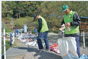
こいのぼりを一つひとつ丁寧に取り付ける

園と浅羽東小学校は、春の里山を訪れ、自然の中で遊ぶながら親睦を深めます。荒れた山だったこの場所は、子どもたちの笑い声が響く地域のコミュニティの場として、再び親しまれるようになりました。