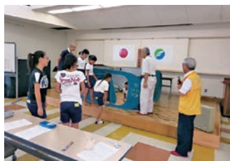
防災キャンプによる避難所運営訓練(子ども刮目舎)

東海道の歴史と地域資源を生かし、地域住民の絆を大切にした地域づくり・まちづくりを進めていきます。