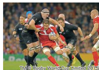
パワーのジョージア