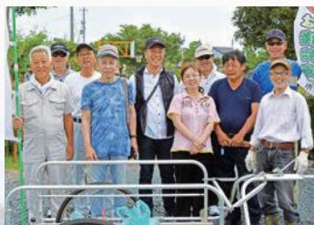
地域で取り組む美化運動