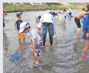
水生生物観察会の様子

※夏の星空観察会の情報は本紙6ページ、水生生物観察会の情報は9ページに掲載しています