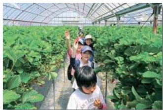
地元農家農場でのイチゴ狩り