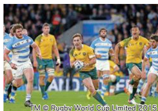
スピードのオーストラリア

3回目の優勝を狙うオーストラリアと、悲願のプール初突破を狙うジョージア。プレースタイルが対極的とも言える両チームがどのような熱戦を繰り広げるのか、目が離せません！