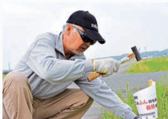
ふん放置防止の看板を設置

また、放置された犬のふんの後始末をはじめ、飼い主へ向けた啓発活動として、看板の設置なども行っています。