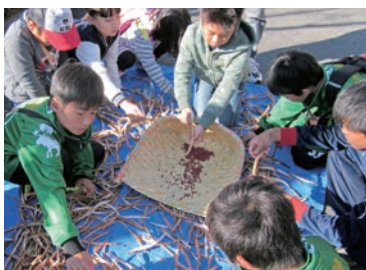
収穫したささげ豆の皮むき