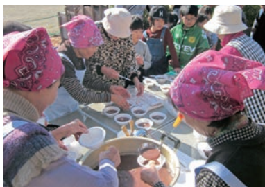
参加者全員でお汁粉を味わう