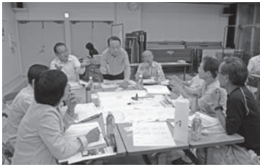
地域の課題を洗い出すワークショップ

今後も、継続的にワークショップを行い、より良い地域づくりに向けた取り組みが進められます。