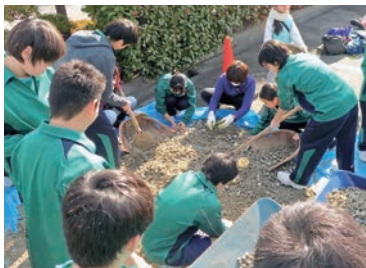
中学生も製作に参加