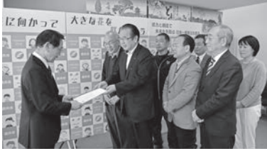
住民でまとめた提言書を市へ提出