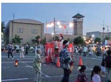
復活した盆踊り会