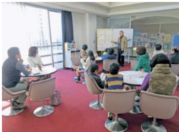
ワークショップで意見出し

完成後のウッドデッキの活用や管理方法についての意見交換も行っており、地域の居場所として定着させていきます。