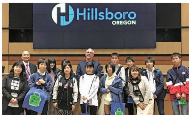
平成30年度学生派遣(ヒルズボロ市役所)