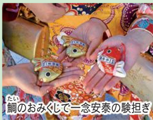
鯛のおみくじで一念安泰の験担ぎ