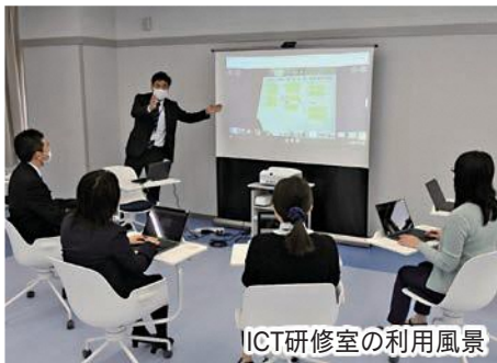
ICT研修室の利用風景

幼小中一貫教育の推進や教育現場におけるICT技術の活用などの教育の充実を目的に設置したもので、教育企画課や学校教育課、すこやか子ども課などの市教育委員会事務局も同館内に集約。幼児教育から小・中学校における教育に関する相談にワンストップで対応します。館内には、外国人の児童・生徒に日本語指導を行う初期支援教室や学びたい人が誰でも利用できる交流・自主学習コーナー、ICTを活用した新しいスタイルの授業を研究する教員向けの研修室などもあり、市の新たな教育拠点として利用していきます。