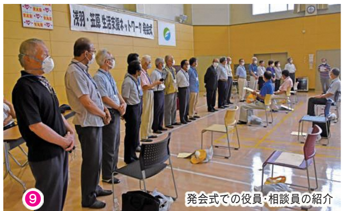
9 発会式での役員・相談員の紹介