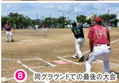
8 同グラウンドでの最後の大会