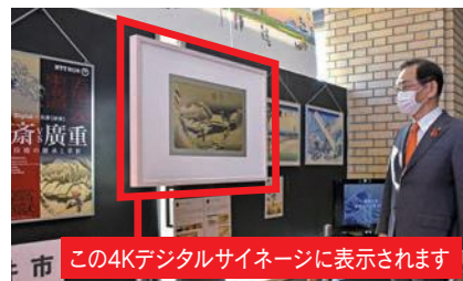
「Digital×北斎【破章】北斎vs広重」袋井市役所サテライトミュージアムは、市役所1階・市民ホールで開催中です。(日時:2月下旬までの市役所開庁日 午前8時30分~午後5時)

オンラインを中心とした文化・芸術の継承や発信、そして鑑賞は、これからの時代のスタイルとして定着していくことでしょう。