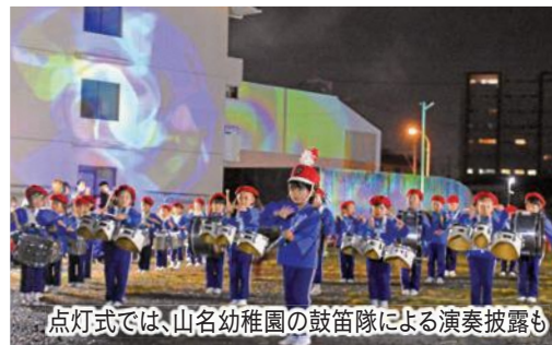
点灯式では、山名幼稚園の鼓笛隊による演奏披露も

夜のにぎわい創出を目的に市観光協会が実施しているもので、点灯式が行われた三門町の空き地では、約1万球のイルミネーションで飾られた「ふくろい夜宵の森」も登場。明かりが灯ると、暗闇の中に幻想的な光の森が浮かび上がりました。駅前や夜宵の森のライトアップは1月末まで実施。期間中は「夜宵スタンプラリー」や「インスタフォトコンテスト」などのイベントも開催されています。