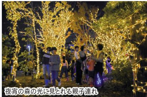
夜宵の森の光に見とれる親子連れ

11月20日、袋井駅周辺や遠州三山の境内などを光のオブジェやライトアップで彩る「ふくろい夜宵プロジェクト」が始まりました。