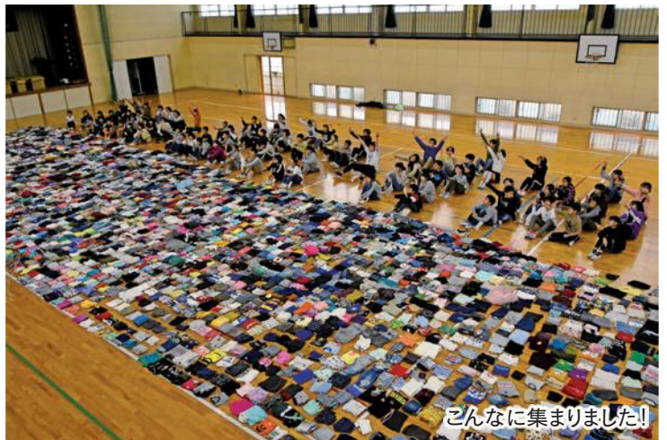
こんなに集まりました!