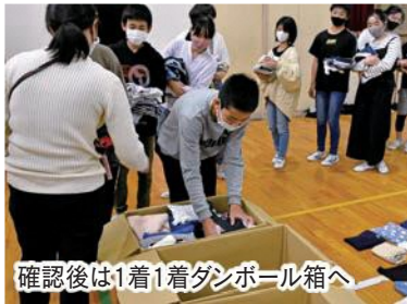
確認後は1着1着ダンボール箱へ

保護者向けに手紙を書いたり、校内用ポスターを作ったり、他学年にも趣旨を説明したりするなどして回収を呼び掛けたもので、ほぼ全ての児童の家庭が協力し、約3,000枚の服が集まりました。集めた服は、同活動を展開しているユニクロを通じて、難民の子ども達へと届けられます。