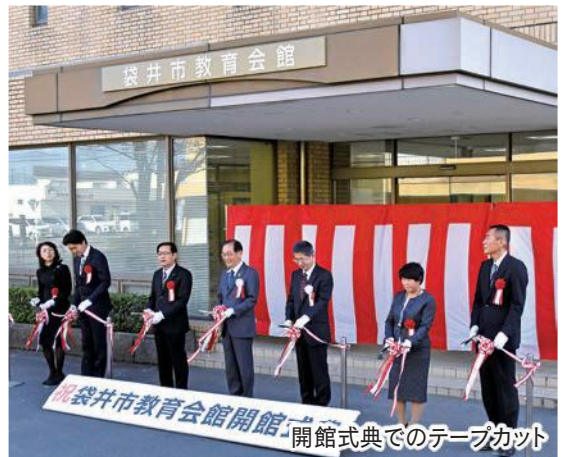
袋井市教育会館開館式典でのテープカット