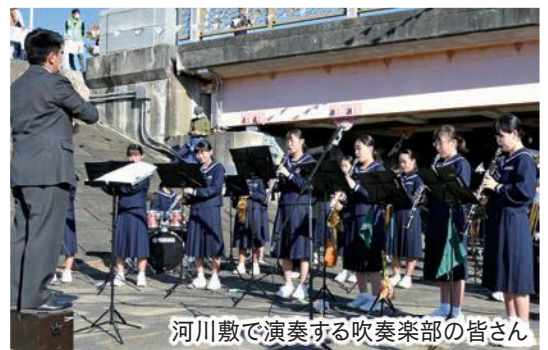
河川敷で演奏する吹奏楽部の皆さん