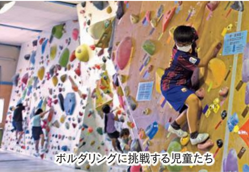
ボルダリングに挑戦する児童たち

市子ども会育成連合会のチャレンジ冒険遊び事業として同地区子ども会が実施したもので、多くがボルダリング初体験。決められたホールド(壁を登る際に手がかりとなる突起物)のみを使って登る同競技のルールの中、手や指でどこをつかみ、次にどのホールドに手足を伸ばすかを考えながら登るなど頭と体を総動員し、夢中になって挑戦していました。