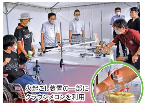
火起こし装置の一部にクラウンメロンを利用

県内市町が地域の特色を活かして各地で採火するもので、本市では静岡理工科大学作成の火起こし装置と袋井特別支援学校生徒作成のキャンドルを使い、種火をランタンに移しました。