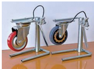
ストッパーはカム型とギヤ型の2種から選べ、各種サイズにも対応

台車などに取り付けるキャスターに操作レバーを接続して、手元のレバーでストッパーのオン・オフを制御できるようにしたもの。