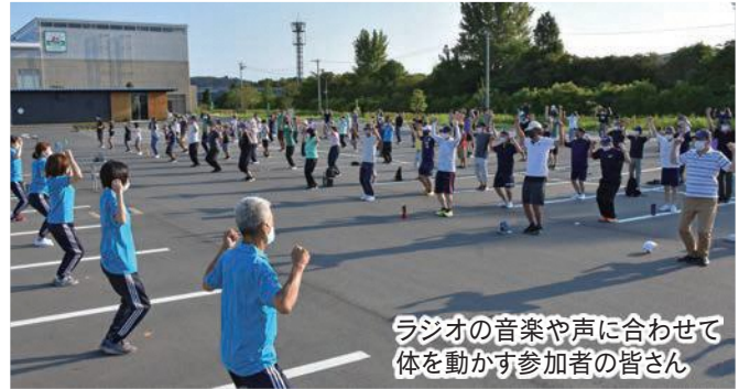
ラジオの音楽や声に合わせて体を動かす参加者の皆さん

市民の健康増進と正しい体操方法を伝えることで地域での手本になってもらうことを目的に毎年開催しているもので、約200人の市民が朝から爽やかな汗を流しました。