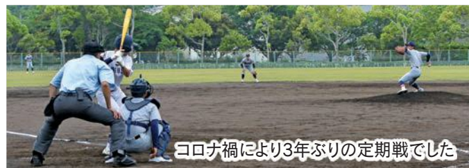
コロナ禍により3年ぶりの定期戦でした

試合は、1対1で迎えた5回裏に袋井高校が適時打で2点を追加。その後、袋井商業高校も反撃を狙いますが叶わず、3対1で終了し、通算成績は袋井高校が25勝、袋井商業高校が15勝となりました(引き分け1、中止4)。両校とも7月の全国高校野球選手権大会静岡大会に向けて練習を積み重ね、技術や精神面に磨きをかけていきます。