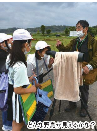
どんな野鳥が見えるかな?

5月26日、三川小学校の4年生が野鳥の観察を行いました。野鳥が生息する郷土の豊かな自然環境を大切に思う気持ちを育むことを目的としたもので、「日本野鳥の会 遠江支部」の会員が観察の仕方などを指導。児童たちは双眼鏡や望遠鏡をのぞき込んで、①アオサギ、②ケリ、③カルガモ、④トビなどの様々な野鳥を見つけては、その姿や特徴をじっくりと観察しました。