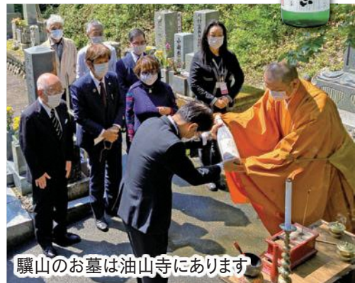
驥山のお墓は油山寺にあります

献酒式は驥山の生誕日(5月20日)に合わせて袋井商工会議所が実施しているもので、地酒「驥山」は同氏の功績を地域振興につなげようと平成19年に企画した日本酒です。「驥山」は市内小売店で販売されています。