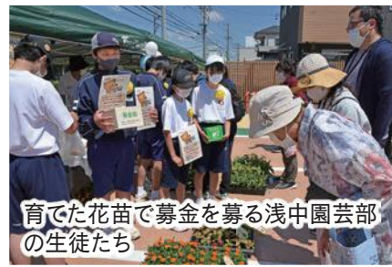
育てた花苗で募金を募る浅中園芸部の生徒たち