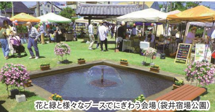
花と緑と様々なブースでにぎわう会場(袋井宿場公園)

花の魅力や花のある暮らしを感じてもらおうと、花咲くふくろい推進協議会(主催)と一般社団法人どまんなかセンター(企画・運営)が実施したもので、花や多肉植物の展示販売のほか、自然素材のスイーツや軽食の販売、花に関するワークショップなどを開催。花をテーマとした共創の取組の一環として、高砂フードプロダクツ(株)と浅羽中学校の園芸部も参加し、来場者は花との触れ合いを楽しみました。