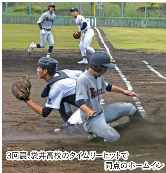
3回裏、袋井高校のタイムリーヒットで同点のホームイン