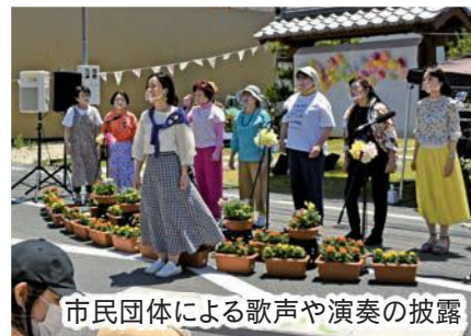
市民団体による歌声や演奏の披露