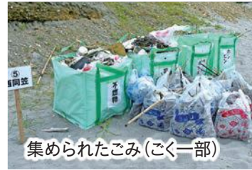
集められたごみ(ごく一部)

郷土の海の保全や利活用、魅力発信につなげていくため、「海のにぎわい創出プロジェクト」の一環として開催。地域の住民や企業、海岸利用者、各種団体、浅羽中学の生徒など約700人が参加し、海岸のごみなどを拾い集めました。