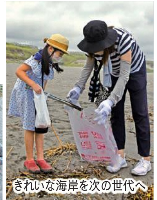
きれいな海岸を次の世代へ