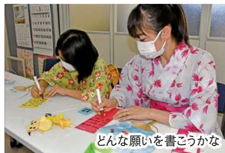
どんな願いを書こうかな

日本の伝統文化への理解を深めてもらおうと、国際ソロプチミスト袋井と袋井国際交流協会が実施したもので、まずはスタッフの手伝いで参加者は涼し気な浴衣に着替え。その後、短冊に願いを書いてみんなで笹に結び付けたり、浴衣姿でまちを散策をしたり、抹茶をいただいたりと、楽しい交流の時間を過ごしました。