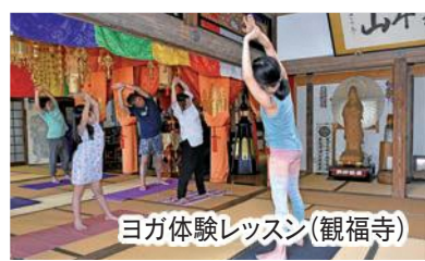
ヨガ体験レッスン(観福寺)