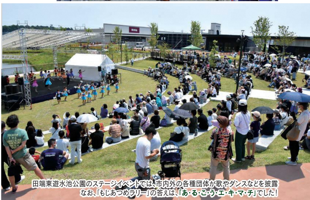
田端東遊水池公園のステージイベントでは、市内外の各種団体が歌やダンスなどを披露 なお、「もじあつめラリー」の答えは、「あ・る・こ・う・エ・キ・マ・チ」でした!