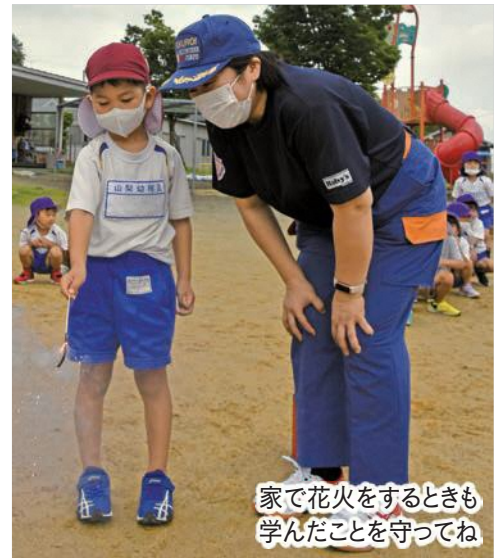
家で花火をするときも学んだことを守ってね