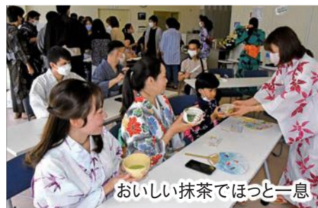
おいしい抹茶でほっと一息