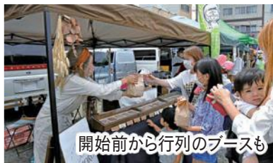
開始前から行列のブースも

“まちなか”を歩いて巡る楽しさやまちの魅力を再発見してもらおうと開催したもので、広場や公園、施設、商店など、駅南・駅北の7つの会場でステージイベントやマルシェ、ワークショップなどの多彩な催しを実施。同日、市内ではクラウンメロンのPRイベントやeスポーツイベントも開催され、1万人を超える来訪者がまちでの催しを楽しみました。