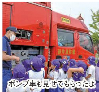
ポンプ車も見せてもらったよ

園児たちは、女性消防団員による紙芝居の読み聞かせで防火の大切さを学んだ後、園庭で実際に花火を体験。「花火は大人と一緒にやる」、「火は人に向けない」、「最後はきちんと水につけて消火する」などのルールや手順を確かめながら、安全な花火の楽しみ方を学びました。