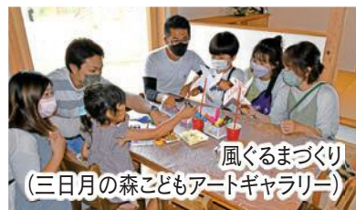
風ぐるまづくり (三日月の森子どもアートギャラリー)