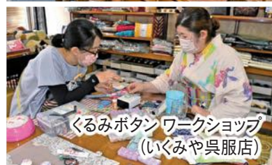
くるみボタンワークショップ (いくみや呉服店)