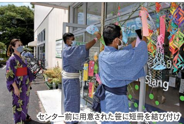
センター前に用意された笹に短冊を結び付け

7月2日、袋井国際交流センターで七夕をテーマとした交流イベント「浴衣をきて七夕まつりを体験しよう!」が開催され、ブラジルやベトナム、アメリカなど7か国・38人の市内在住の外国人が参加しました。