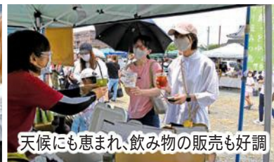
天候にも恵まれ、飲み物の販売も好調