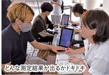
どんな測定結果が出るかドキドキ

若い世代の野菜摂取量を増やす取組「ふくろいサラダ事業」の一環として実施したもので、測定にはセンサーの上