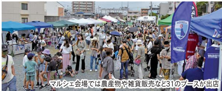
マルシェ会場では農産物や雑貨販売など31のブースが出店