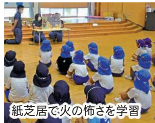
紙芝居で火の怖さを学習