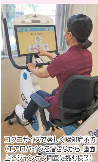
コグニサイズで楽しく認知症予防(エアロバイクを漕ぎながら、画面上でジャンケン問題に挑む様子)

認知症外来では、本人や家族からの問診、認知症評価スケールによる物忘れの程度の評価、脳MRI撮影などで、認知症の有無や進行度合いを診断。早めの対応や適切な対処が、症状の改善や安定につながります。