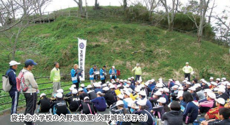
袋井北小学校の久野城教室(久野城址保存会)