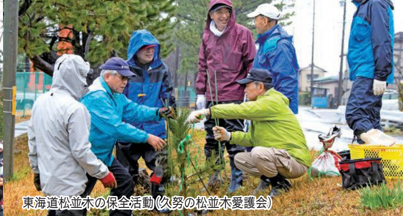
東海道松並木の保全活動(久努の松並木愛護会)