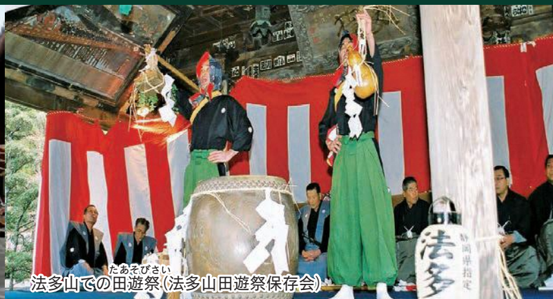
法多山での田遊祭(法多山田遊祭保存会)

文化財保護法により規定される、「有形文化財」「無形文化財」「民俗文化財」「記念物」「文化的景観」「伝統的建造物群」の6類型の文化財のほか、埋蔵文化財や文化財を次世代へ継承する上で欠かせない文化財の材料製作・修理等の伝統的な保存技術等を対象としています。 また、類型に当てはまらない、地域で語り継がれてきた伝承(昔話)なども対象に含めるなど、従来の指定の枠に捉われない、地域にとって残すべき大切なものを幅広く対象としました。