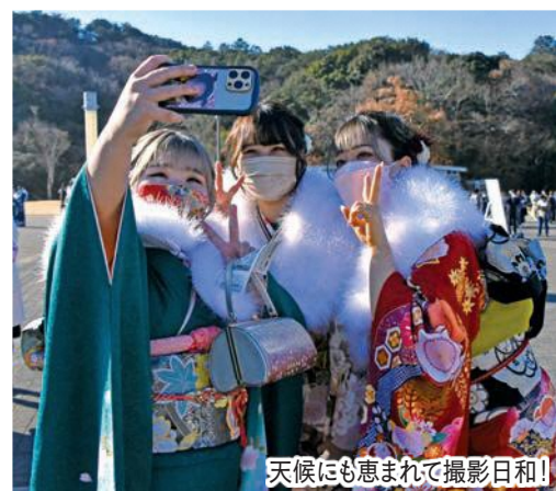
天候にも恵まれて撮影日和!

1月8日、従来の成人式にあたる「はたちの集い」が開催され、20歳の対象者909人中646人が一堂に会しました。