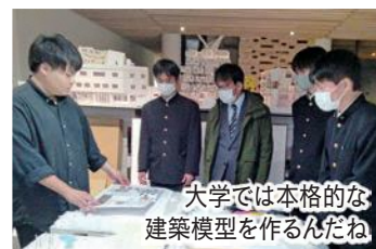
大学では本格的な 建築模型を作るんだね

大学や理系学問への関心を深め、進路意識を高めることを目的に、市・大学・高校の三者が連携し年5回実施した事業で、高校生たちは興味がある研究室で教員や大学生と交流し、大学で学ぶ自分をイメージする機会となりました。