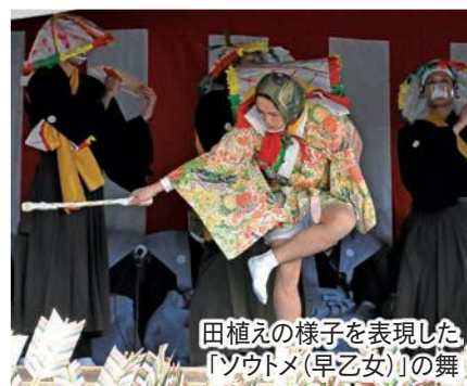
田植えの様子を表現した 「ツグメ(早乙女)」の舞

五穀豊穡を祈願し、法多山田遊祭保存会の会員が1年間の米作りの様子を表現した7段の舞を奉納。その後、大弓放ちの神事を行い、1年の厄払いをしました。