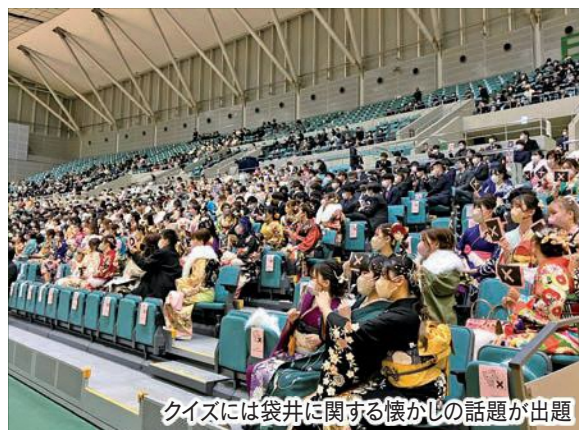
クイズには袋井に関する懐かしの話題が出题

式典では、代表4人が「社会貢献や親孝行をしたい」「社会人としてより精進していきたい」などと力強く述べました。市内外で活躍する先輩市民等からのメッセージの披露や「20年間の歩み振り返りクイズ」なども行われ、みんなで二十歳の門出を祝いました。