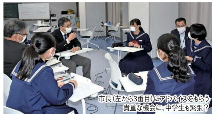
市長(左から3番目)にアドバイスをもらう 貴重な機会に、中学生も緊張?