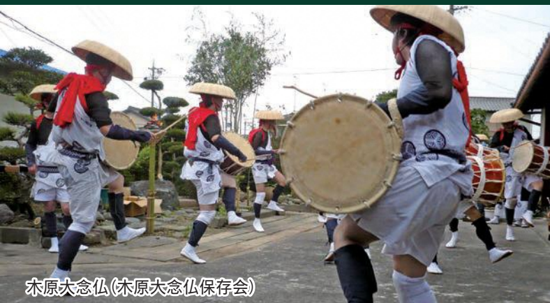
木原大念仏(木原大念仏保存会)