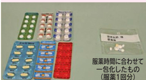
服薬時間に合わせて一包装したもの(服薬1回分)