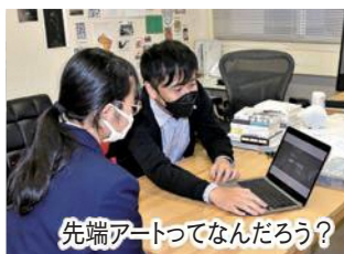
先端アートってなんだろう?