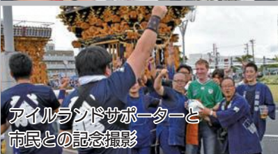
アイルランドサポーターと市民との記念撮影