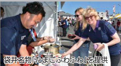
袋井名物「たまごぶんわ」を提供

また、エコパでの試合開催日には「おもてなしエリア」にて飲食提供やお祭り屋台の展示などを行い、国内外からの観戦客を「おもてなし」し、袋井の魅力を発信しました。