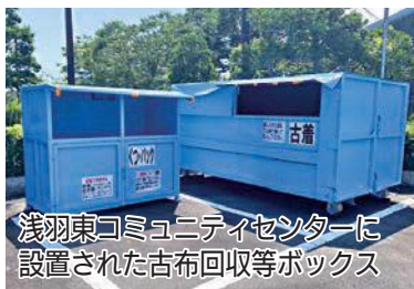
浅羽東コミュニティセンターに設置された古布回収等ボックス

また、回収による収入は、各まちづくり協議会が行う地域づくりの資金となります。可燃ごみ削減と地域活動応援のため、ぜひコミセンの古布等回収ボックスをご利用ください。