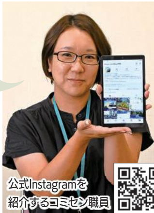
公式Instagramを紹介するコミセン職員

今後も、フォロワー数の増加と袋井南地区の活性化をめざし、地域密着型の情報発信を意識していきます。