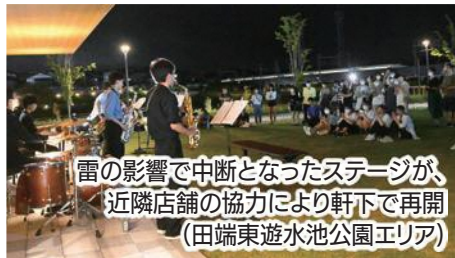
雷の影響で中断となったステージが、 近隣店舗の協力により軒下で再開 (田端東遊水池公園エリア)