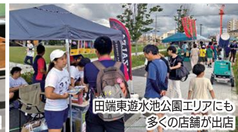
田端東遊水池公園エリアにも 多くの店舗が出店