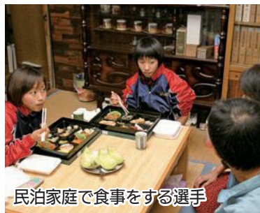
民泊家庭で食事をする選手