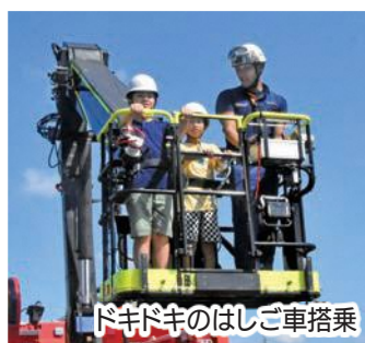
ドキドキのはしご車搭乗

防火・防災に関する知識を身に付けるとともに、学校や家庭、地域での防火・防災リーダーになってもらうと毎年実施しているもので、子どもたちはグループに分かれて、はしご車への搭乗やポンプ車を使った放水、地震体験車や煙体験施設を利用した震災・火災時の身の守り方の学習、消防庁舎の見学などを行いました。