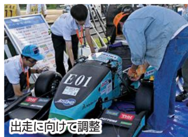
出走に向けて調整

未来のエンジニア育成を目的に開催されている大会で、ガソリンエンジン車と電気自動車(EV)の2部門で構成。地元・静岡理科大学はEV部門で出場しました。来年からは会場が愛知県常滑市に変更となることが決定しており、ホームでの最後の大会にメンバーは全力を尽くしました。