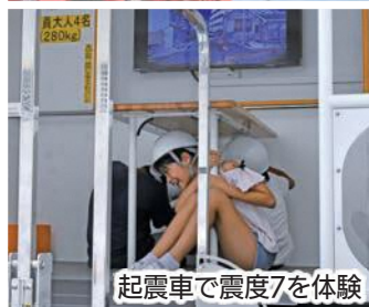
起震車で震度7を体験