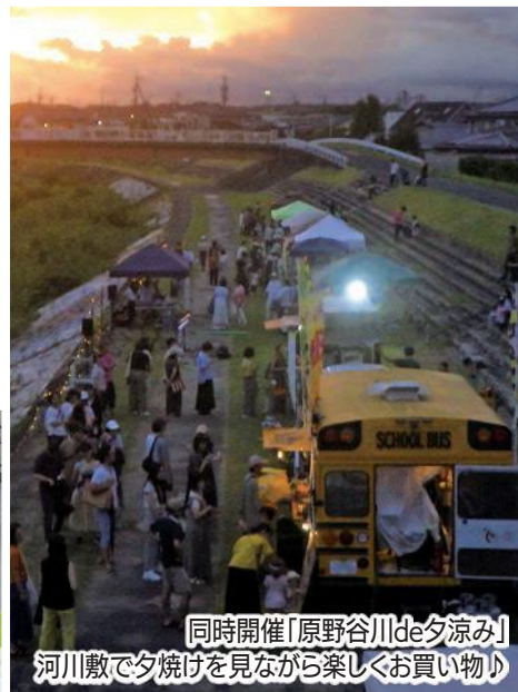
同時開催「原野谷川de夕涼み」 河川敷で夕焼けを見ながら楽しくお買い物!

同イベントは、“まちなか”を歩いて巡る楽しさやまちの魅力を再発見してもらうことを目的に昨年度から市が開催しているもので、今回は袋井商工会議所青年部による「街LOVE EXPO」、一般社団法人どまんなかセンターによる「原野谷川de夕涼み」も同時開催。約60の店舗・団体等が参加し、袋井駅周辺の各所でマルシェ、ワークショップなどが行われました。夕方から夜にかけての開催で、日没後の袋井駅周辺は親子連れからお年寄りまで多くの方でにぎわいました。