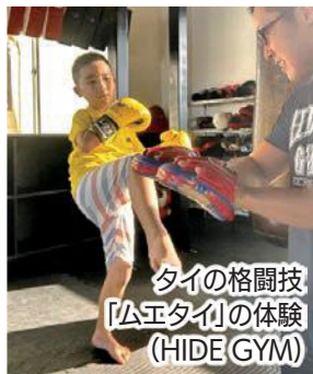
タイの格闘技 「ムエタイ」の体験 (HIDE GYM)