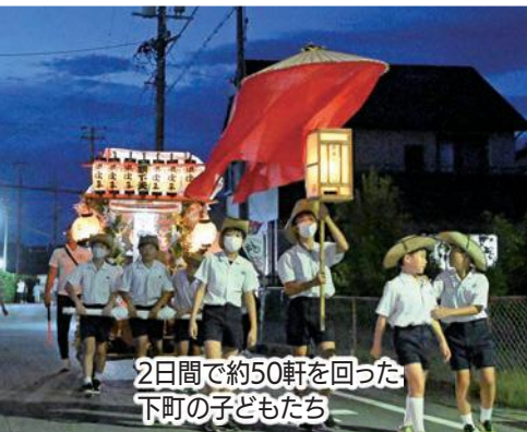
2日間で約50軒を回った 下町の子どもたち

8月13・14日、山梨地区で小学生が初盆の家を回って念仏を唱える「かさんぼこ」が4年ぶりに行われました。