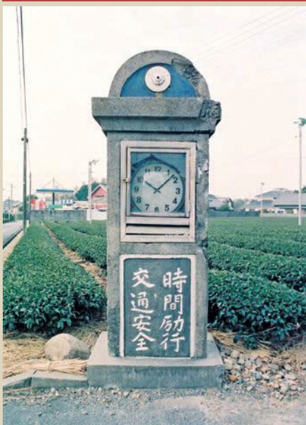
塔の寸法は、高さ190センチメートル、幅60センチメートル、奥行き37センチメートル。振り子時計の頃は、毎朝ラジオの時報で針を合わせていました。

時計塔の正面には「時間励行」と「交通安全」の2つの標語が刻まれています。「時間励行」は、村の集会に遅刻しないこと、「交通安全」は、この頃普及が始まった自転車の交通事故防止を呼び掛けています。歴史を感じる時計塔は、地元の人たちに何回も修理いただきながら動き続け、2025年には100歳を迎えます。今日も小学校に通う子どもたちや、茶畑に向かう軽トラック、グラウンドゴルフに向かう高齢者などを優しく見送っています。