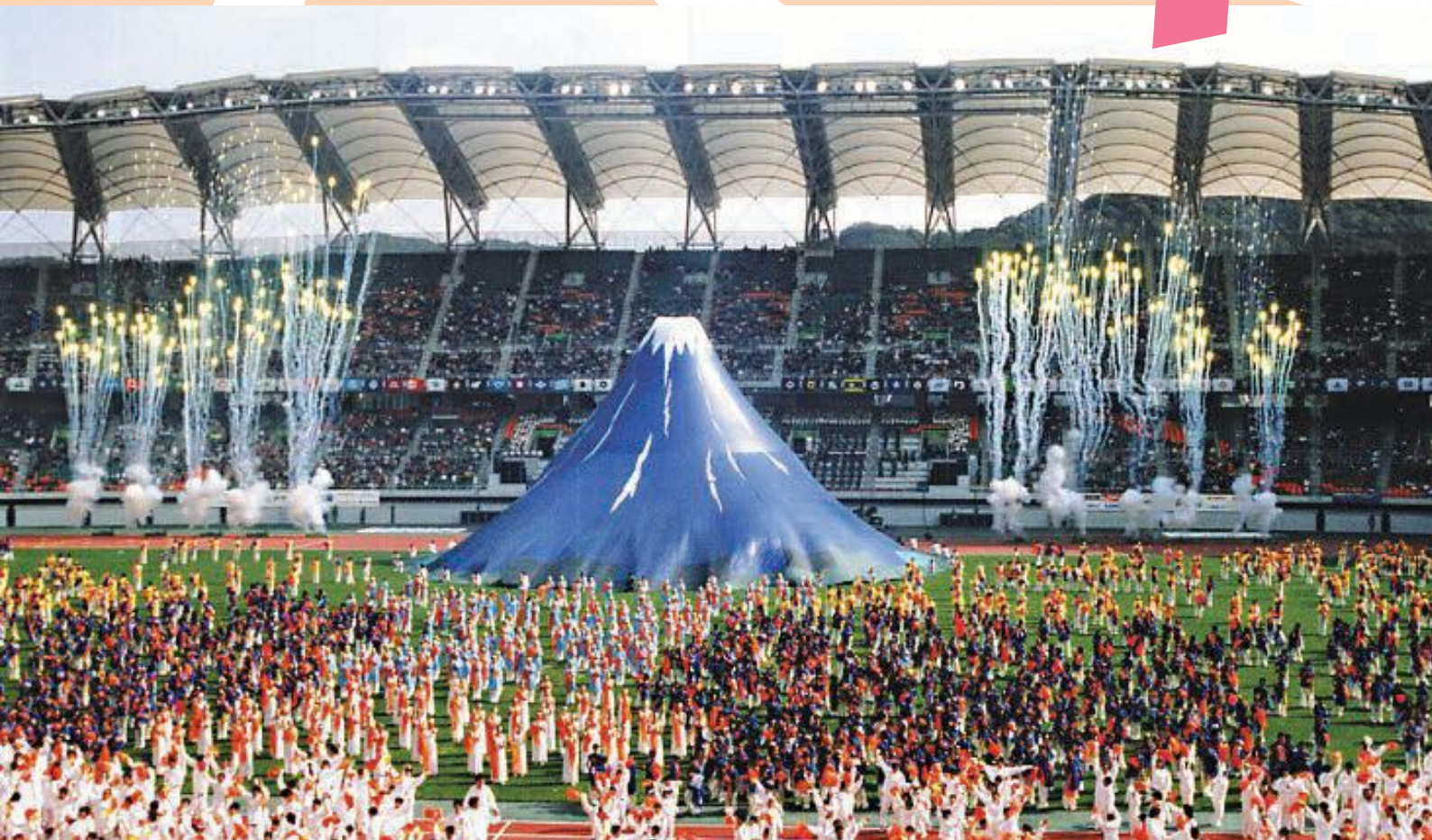
「NEW!!わかふじ国体」秋季大会 開会式の様子

☎スポーツ政策課スポーツ推進係 TEL44 - 3139 ✉sports@city.fukuroi.shizuoka.jp 〒437-8666