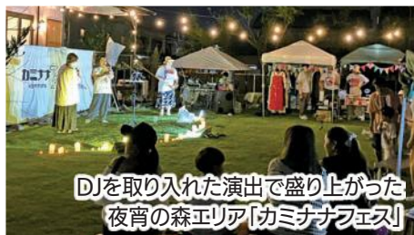
DJを取り入れた演出で盛り上がった 夜宵の森エリア「カミナナフェス」