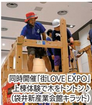
同時開催「街LOVE EXPO」 上棟体験で木をトントシ (袋井新産業会館キラット)