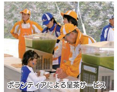
ボランティアによる呈茶サービス