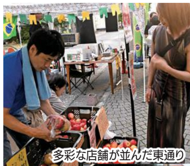
多彩な店舗が並んだ東通り