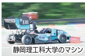
静岡理科大学のマシン

8月28日～9月2日、学生たちが設計・制作したレーシングカーの性能を競う「学生フォーミュラ日本大会2023」が小笠山総合運動公園で行われました。