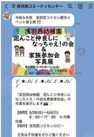
浅羽西「ミセン」公式LINE 地域の幼稚園児の写真展について配信

今後も、LINE登録者がもたらす嬉しくなるような情報の配信や、文字だけでなくチラシやバナー画像をいれて配信するなど目を引くような工夫をすることで、浅羽西「ミセン」からの配信を楽しみに思ってもらえるよう頑張ります。