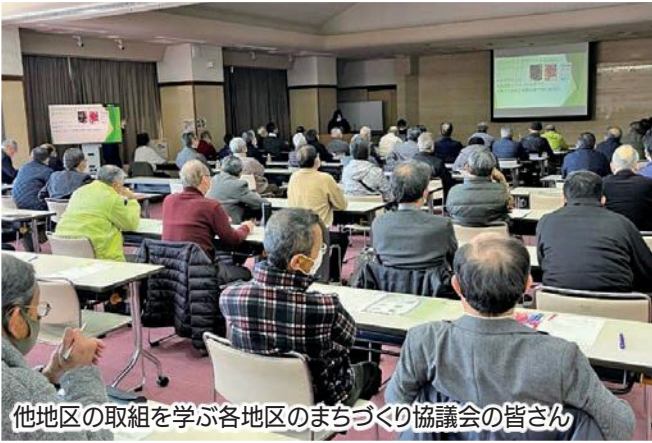
他地区の取組を学ぶ各地区のまちづくり協議会の皆さん