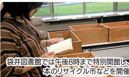
袋井図書館では午後8時まで特別開館し、 本のリサイクル市などを開催