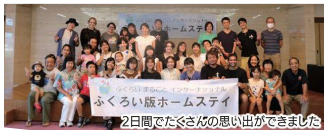
2日間でたくさんの思い出ができました

1泊2日という短い期間でしたが、ホームステイを通してゲストも家族の一員に。お別れの時は、名残惜しい姿が見られました。