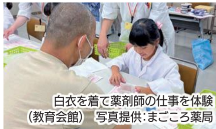
白衣を着て薬剤師の仕事を体験 (教育会館)