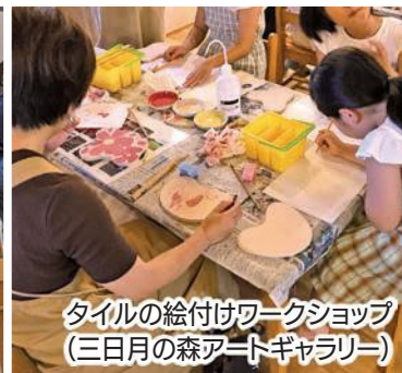
タイルの絵付けワークショップ (三日月の森アートギャラリー)