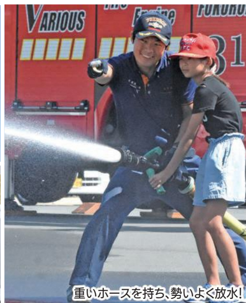
重いホースを持ち、勢いよく放水!