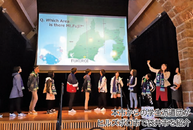
本市からの学生派遣団がヒルズボロ市で袋井市を紹介

姉妹都市提携35周年を記念し、11月17日（金）まで、市役所1階・市民ホールにて記念展示を行っています。ぜひご覧ください。