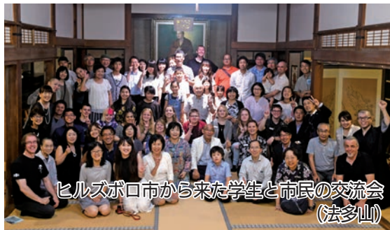
ヒルズボロ市から来た学生と市民の交流会（法多山）