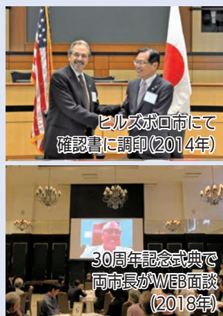
ヒルズボロ市にて 確認書に調印(2014年)