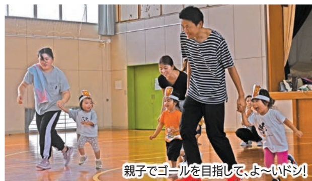
親子でゴールを目指して、よーいドン!

「ちびっこスポーツランド」のプログラムの一環で、子どもたちは講師手作りのお面を付けてフッピーに変身!フッピーになりきって、親子でかけっこ・玉入れ・リレーを楽しみました。