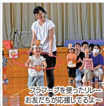
フラフープを使ったリレー お友だちが応援してるよ~