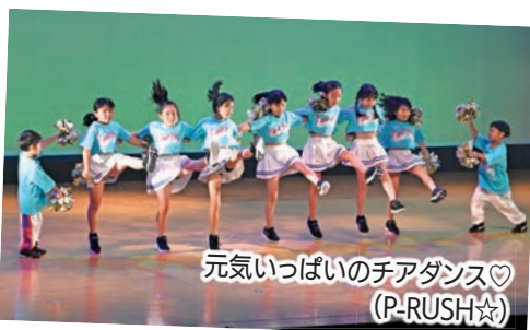
元気いっぱいのチアダンス♡ (P-RUSH☆)