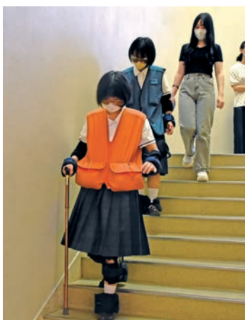
アイマスクと手足のおもりで、階段を降りるのも一苦労(高齢者体験)

身体測定などの健康診断や手洗い講座、妊婦体験や高齢者体験など、看護師を目指す学生たちによる多彩なブースが勢ぞろい。4年ぶりに一般公開が行われ、会場は親子連れや中高生などでにぎわいました。