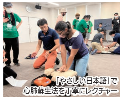
「やさしい日本語」で心肺蘇生法を丁寧にレクチャー

外国人が災害への知識や備えを学び、緊急時に落ち着いて行動できるようになってもらうことを目的に袋井国際交流協会が主催した講座で、参加者たちは消防士による心肺蘇生法やAEDの取り扱い方法などの指導に熱心に耳を傾けました。