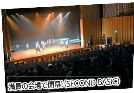
満員の会場で開幕!(SECOND BASIC)