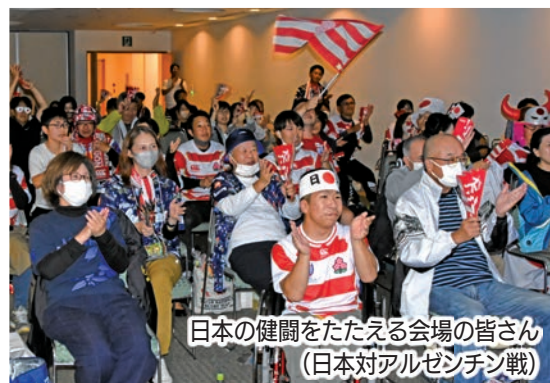
日本の健闘をたたえる会場の皆さん (日本対アルゼンチン戦)

また、10月8日、決勝トーナメント進出をかけた日本対アルゼンチン戦でもパブリックビューイングを実施(会場…エコパスタジアム)。日本は27-39で惜しくも敗れてしまいましたが、試合終了後には会場から盛大な拍手が湧きあがりました。