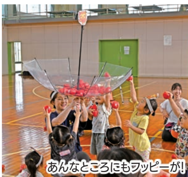
あんなところにもフッピーが!