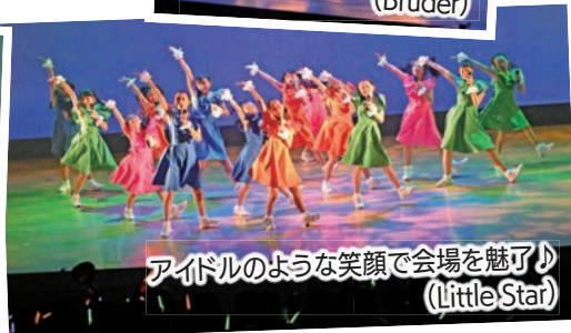
アイドルのような笑顔で会場を魅了♪ (LittleStar)