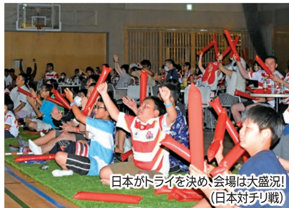
日本がトライを決め、会場は大盛況! (日本対チリ戦)