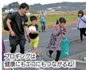
プロギングは健康にもエコにもつながるね!

環境保護活動などを行う団体「River to Sea 製作委員会」が主催したもので、ごみ拾いとジョギングを組み合わせ