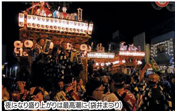
夜になり盛り上がりは最高潮に(袋井まつり)

10月、市内各地区で五穀豊穡や無病息災を祈る祭典が行われました。6～8日には袋井北地区で「袋井北祭り」(主催:袋井北地区祭典委員会)、13～15日には袋井駅周辺で「袋井まつり」(主催:袋井十五町祭典統一委員会)が盛大に繰り広げられました。台風と新型コロナウイルス感染症の影響で、両祭典とも5年振りの本格開催。豪華な屋台の引き廻しとともに力強い掛け声やにぎやかなおはやしなどが、まち全体に響き渡り、袋井の秋を彩りました。