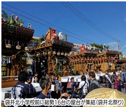
袋井北小学校前に総勢16台の屋台が集結(袋井北祭り)

とも5年振りの本格開催。豪華な屋台の引き廻しとともに力強い掛け声やにぎやかなおはやしなどが、まち全体に響き渡り、袋井の秋を彩りました。