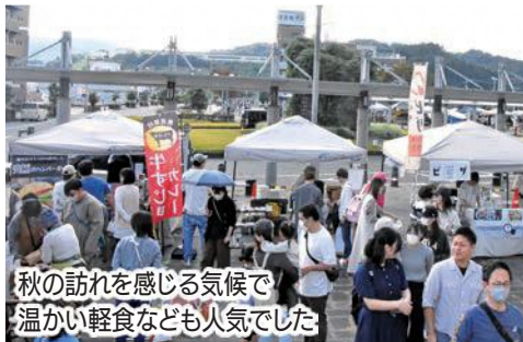
秋の訪れを感じる気候で温かい軽食なども人気でした

愛野地区の有志と市が共催したもので、周辺にお住まいの方はもちろん、愛野駅を発着点とした「さわやかウォーキング」(主催:JR東海)が同日に開催されたこともあり、市外からの来訪者などの姿も多くみられました。