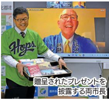
贈呈されたプレゼントを披露する両市長

11月2日、姉妹都市提携締結35周年を記念し、大場市長とヒルズポロ市のスティーブ・キャラウェイ市長がオンラインで交流しました。両市長は、これまでの交流を振り返るとともに、今後の友好関係の継続を誓い合いました。