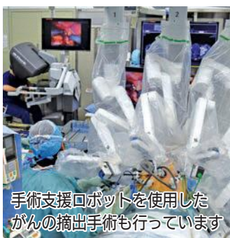
手術支援ロボットを使用したがんの摘出手術も行っています