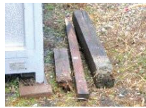
草木に混ざっていた木の加工品

市が昨年、春岡グラウンド駐車場内に開設した、土・日曜日に市民が無料で草木を搬入できる回収所。多くの方に利用いただいている一方、草木以外の物が搬入されていることも散見されます。草木以外の混入はリサイクルの妨げとなり、最悪の場合、回収所を閉鎖することになってしまいますので、正しい利用をお願いします。