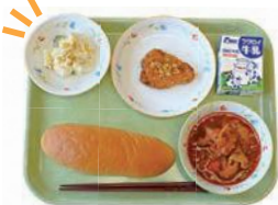
アザレア・セブン応援給食