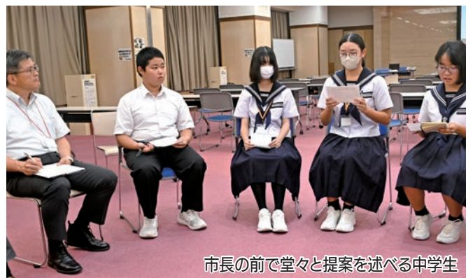
市長の前で堂々と提案を述べる中学生

参加者たちは中学生の提案に真摯に耳を傾け、提案の実現に向けたアドバイスをしました。