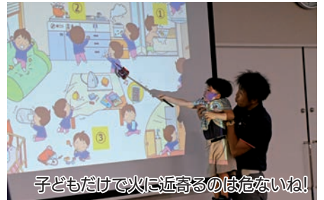
子どもだけで火に近寄るのは危ないね!

方法に関する動画の鑑賞や、イラスト内の危険な行動を見つけて事故を回避するための対策を考える「KYT」(危険予知トレーニング)に取り組んだほか、人形を用いた心臓マッサージなどを体験。様々な角度から救命処置を学ぶことができる貴重な機会となりました。