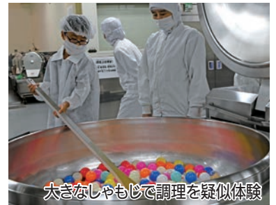
大きなしゃもじで調理を疑似体験

参加者は、白衣と帽子、マスクを身に付け、普段5千食の給食を作っている調理現場へ。食材の下処理や調理、さらには給食を配送トラックに積み込むまでの一連の流れを見て回り、給食への理解を深めました。