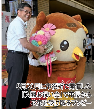
8月20日に市役所で開催した「入閣お祝い会」で市長から花束を受け取るフッピー

映画「もしも徳川家康が総理大臣になったら」の公開に合わせて開催された投票企画「ご当地・偉キャラ総選挙」で