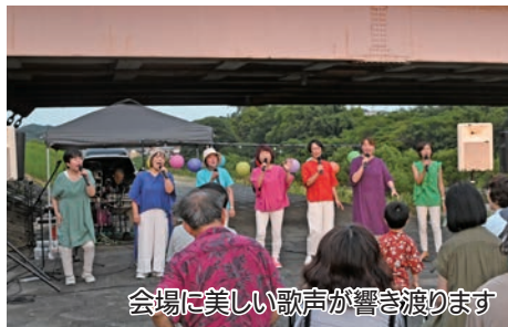
会場に美しい歌声が響き渡ります

このイベントは、(一社)どまんなかセンターが企画・運営。平成29年から始まり、今回で7回目を迎えました。