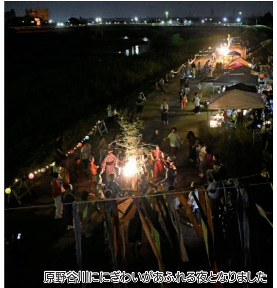
原野谷川ににぎわいがある夜となりました

恒例の雑貨販売やキッチンカーの出店、ワークショップ、音楽ステージのほか、今回は盆踊りを初めて実施。子どもから大人まで、「袋井音頭」などの楽曲に合わせて楽しく踊りました。