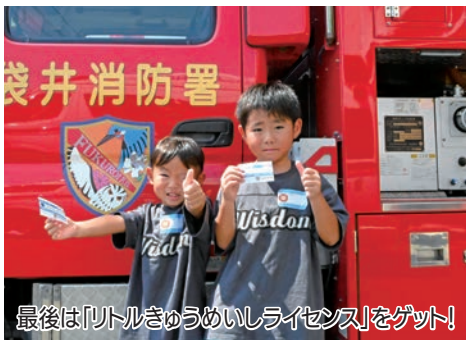
最後は「リトルきゅうめいしライセンス」をゲット!

救命リレーの第一走者として活躍できる子どもの育成を目的に実施されたもので、親子14組が参加しました。参加者は、倒れている人を見つけた時の対応