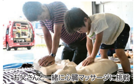
お父さんと一緒に心臓マッサージに挑戦