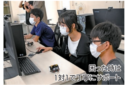
困った時は1対1で丁寧にサポート

講師を務めたのは、地域の子どもたちを対象としたプログラミング教室を開催している静岡理科大学の学生団体「STEP」の皆さん。参加者は、パソコンを使ってプログラムを組み、ロボットカーを「前進する」「四角形に走る」など指示通りに動かす体験を通して、プログラミングの魅力に触れました。