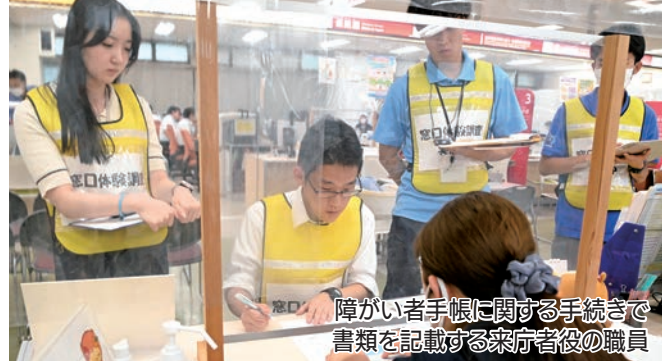
障がい者手帳に関する手続きで書類を記載する来庁者役の職員

☎デジタル政策課BPR推進係 TEL 44-3369 市民課ワンストップ窓口推進室 TEL 44-3108