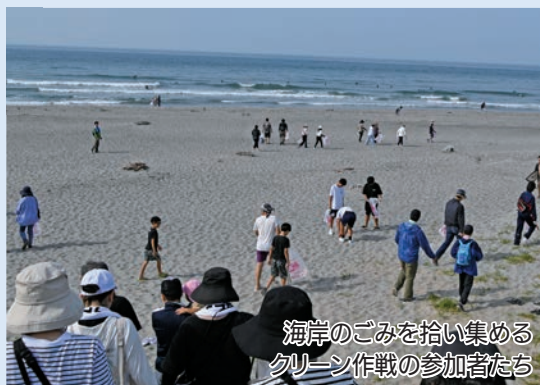
海岸のごみを拾い集める クリーン作戦の参加者たち

市と幸浦地域まちづくり協議会が小学生とその保護者を対象に開催。子ガメを海岸に放ち、生命の尊さについての理解を深めました。