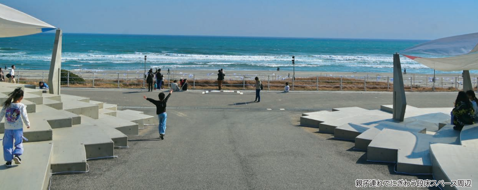
親子連れでにぎわう段床スペース周辺

令和4年度に始まった「海のにぎわい創出プロジェクト」（通称：海プロ）では、利用者の声を参考に、うみてらすDORI（同笠海岸と浅羽体育センター周辺）のにぎわいづくりに向けた環境整備や実証イベントを行っています。現在の整備の進捗状況や今後開催予定のイベントをお知らせします。