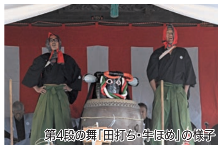
第4段の舞「田打ち・牛ほめ」の様子