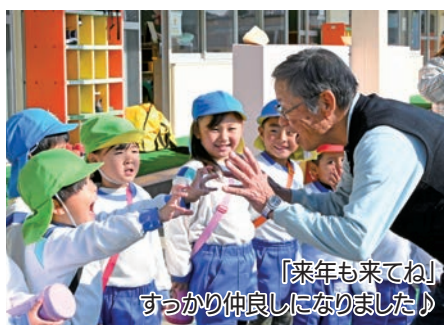
「来年も来てね」すっかり仲良しになりました♪

また、最後には出来たての焼き芋と一緒に味わうなど、世代を超えて工芸品や旬の味覚を楽しむ貴重な機会となりました。