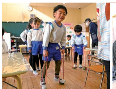
自分で色を塗った竹ぼっくりだよ!