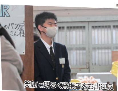
笑顔で明るく来場者をお出迎え