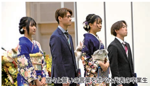
堂々と誓いの言葉を述べた代表の卒業生