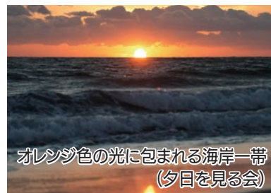
オレンジ色の光に包まれる海岸一帯 (夕日を見る会)

講話を聞いた後、天体望遠鏡をのぞいて月や惑星などを観望し、澄み渡る冬の空を楽しみました。