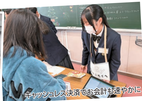
キャッシュレス決済でお会計も速やかに