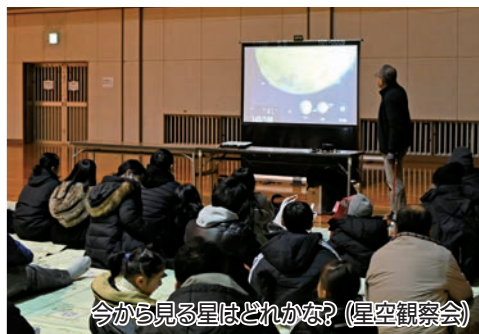
今から見る星はどれかな? (星空観察会)