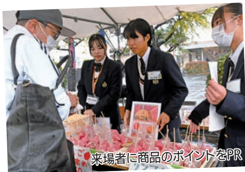
来場者に商品のポイントをPR

生徒の皆さんは、研修や就業体験で学んだことを生かした丁寧な接客で、来場者をもてなしました。