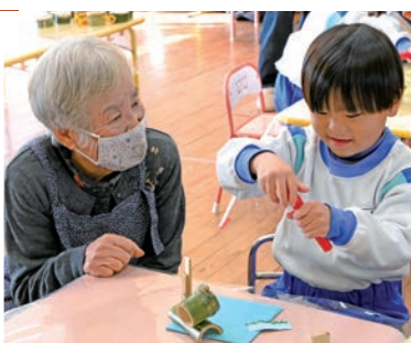
どんな顔を描こうかな～

描いてオリジナルの竹細工飾りを作ったほか、老人クラブの皆さんがこの日のために手作りした竹ぼっくりに好きな色を塗りました。