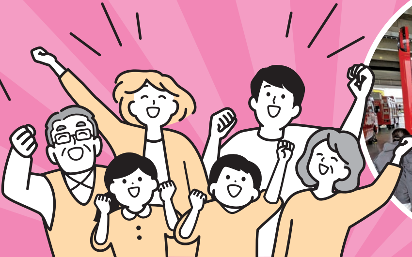
①地域生活支援の活動(三川) ②「笠原クッキング学級」で実施した清水園でのミカン狩り(笠原) ③子どもの消防署見学(浅羽東)

市では、地域住民が主体となった特色ある地域づくり活動を促進しており、「コミュニティセンター」(以下、コミセン)を拠点とした活動を支援しています。2018(平成30)年度に「コミセン」単位で「まちづくり協議会」が設立され、地域の課題やまちづくりに向けた目標の共有化が図られています。