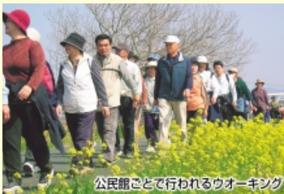
公民館ごとで行われるウォーキング