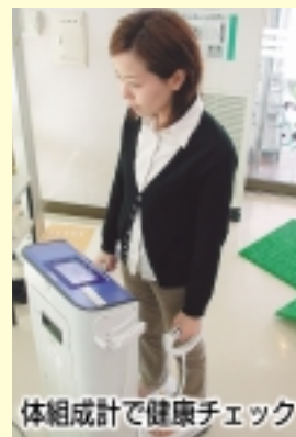
体組成計で健康チェック