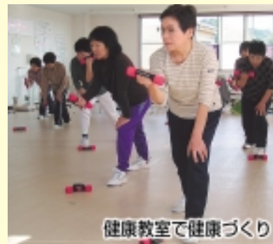
健康教室で健康づくり