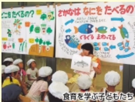
食育を学ぶ子どもたち