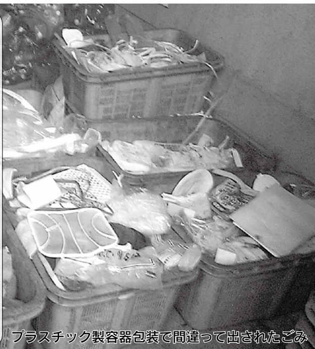
プラスチック製容器包装で間違っ出されたごみ