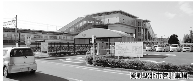
愛野駅北市営駐車場

※国民健康保険特別会計、老人保健特別会計及び簡易水道事業特別会計において、歳出総額が歳入総額を超えている分は、他の特別会計から一時繰替を行っています。