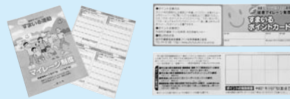
写真左：すまいるカード 写真右：すまいるポイントカード