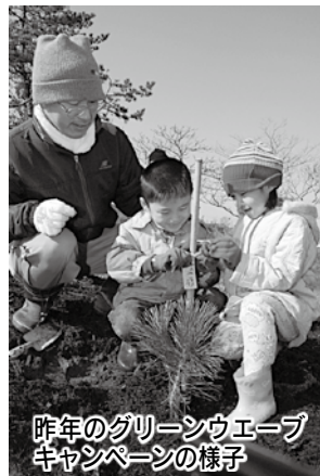
昨年のグリーンウエーブキャンペーンの様子