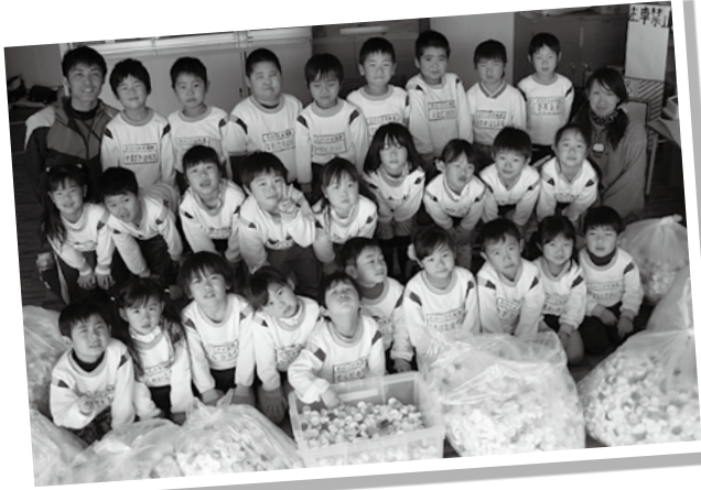
エコカップで世界の子どもにワクチンを♥ ペットボトルのふたを25,000個集めて、ジャスコ袋井店に寄付したよ。 若草幼稚園