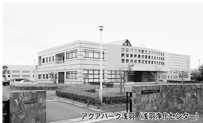
アクアパーク浅羽（浅羽浄化センター）

※国民健康保険特別会計において、歳出総額が歳入総額を超えている分は、他の特別会計から一時繰替を行っています。