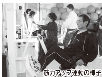
筋力アップ運動の様子

⑩⑨ 健康づくり政策課健康企画室 ☎44-3138 FAX44-3117 ✉ kenkoudukuri@city.fukuroi.shizuoka.jp