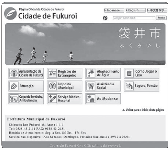
↑生活情報案内ページ(ポルトガル語版トップページ)