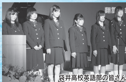
袋井高校英語部の皆さん