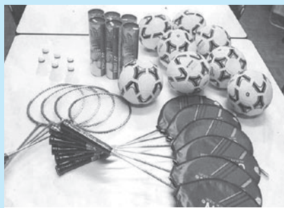
◆浅羽中学校 球技大会などで使用する用具の購入費の一部として活用しました。