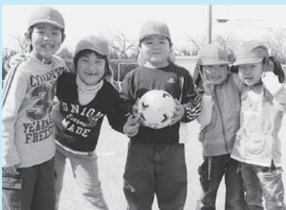
◆笠原保育所 サッカーボールの購入費の一部として活用しました。